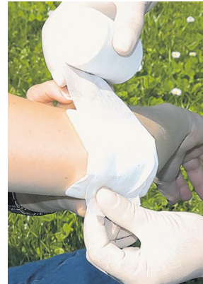
Komresse mit Gazebinde fixieren.