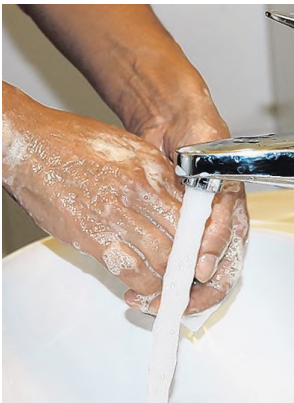
Hände waschen und Handschuhe überstreifen.