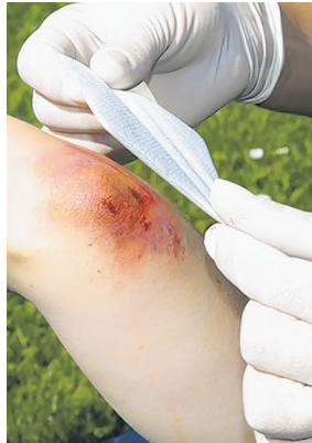
Sterile, nichtklebende Komresse auf die Wunde legen.