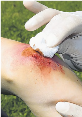
Wunde mit Desinfektionsmittel vorsichtig abtupfen.