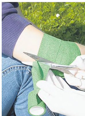
Dieselbe Wunde fixiert mit Nova Press (selbsthaftende elastische Bandage), Abschluss am Oberarm Aussenseite.