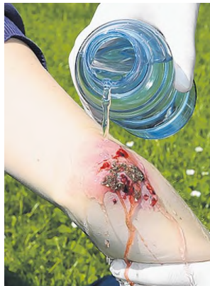
Wunde auswaschen, möglichst mit Trinkwasser.